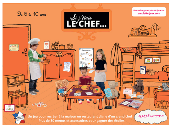
Si j'étais le Chef